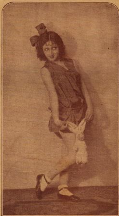
ANGELITA ROS, eminente canzonetista de Arte refinado y cultural