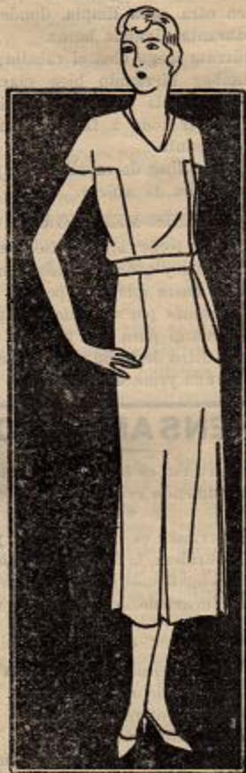
Vestido para joven

Si el alioli no adquiere la consistencia